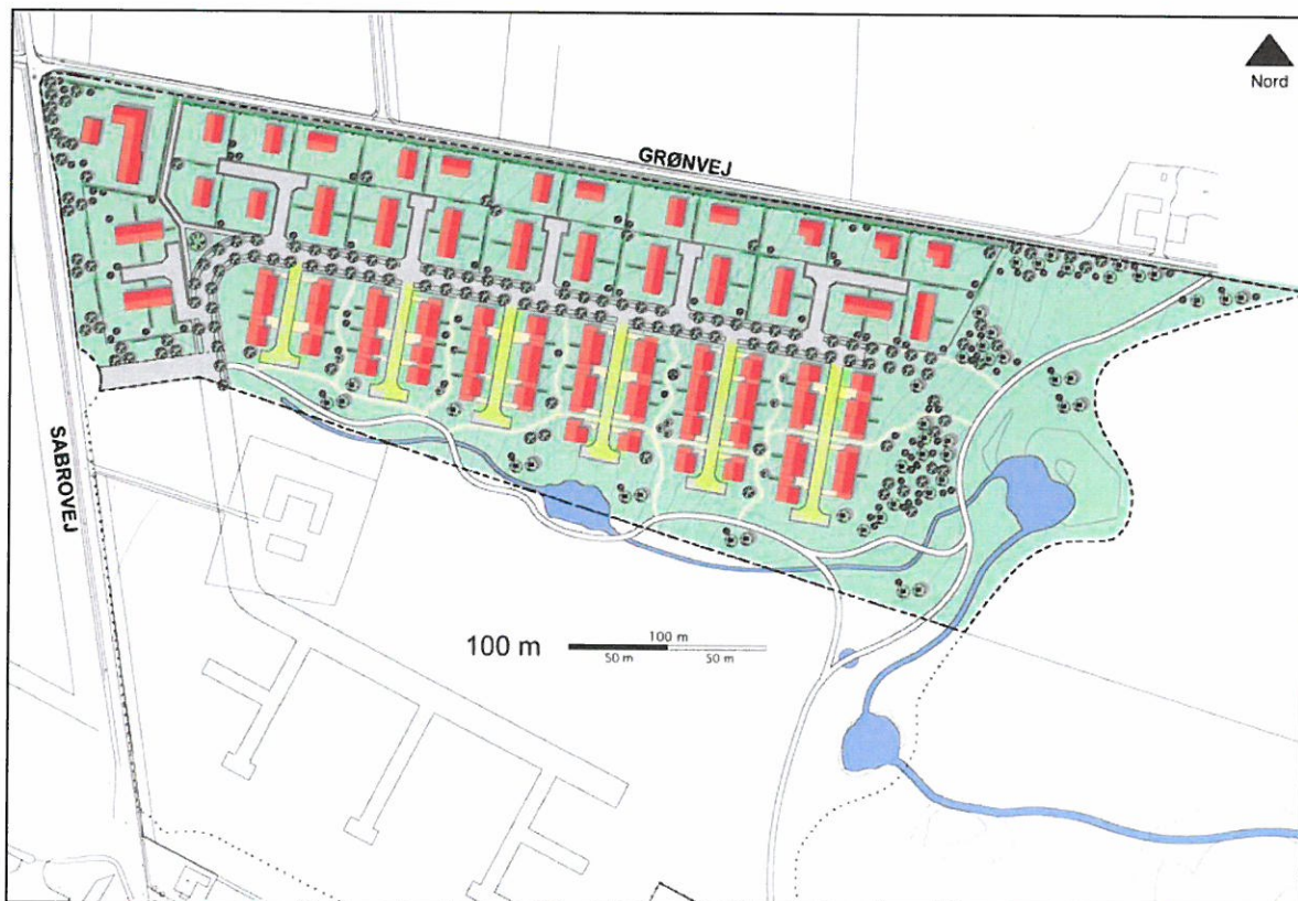
Illustrationsplan, der viser hvordan lokalplanområdet kan komme til at se ud.