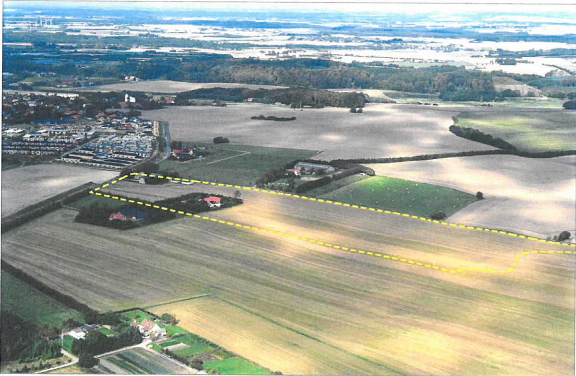
Luffoto af lokalplanområdet og den østligste del af Sabro, set fra syd-øst.